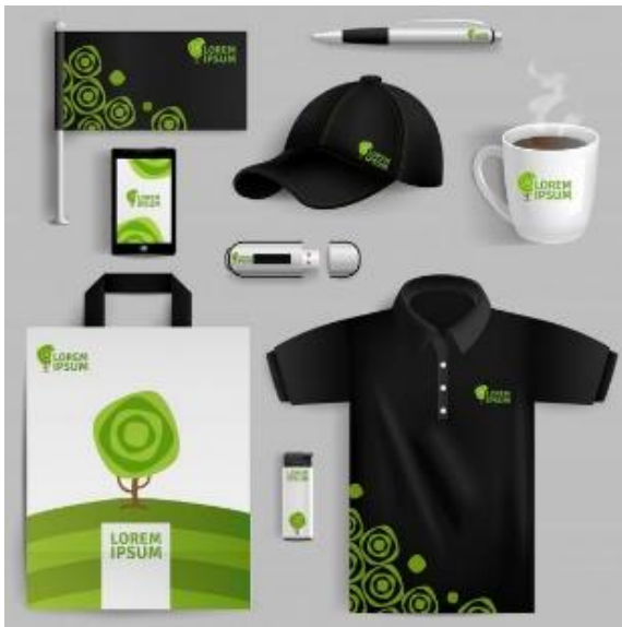
Izdelava celostne grafične podobe