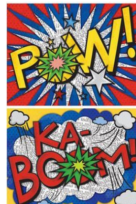
Delovanje znotraj klasičnih likovnih področij